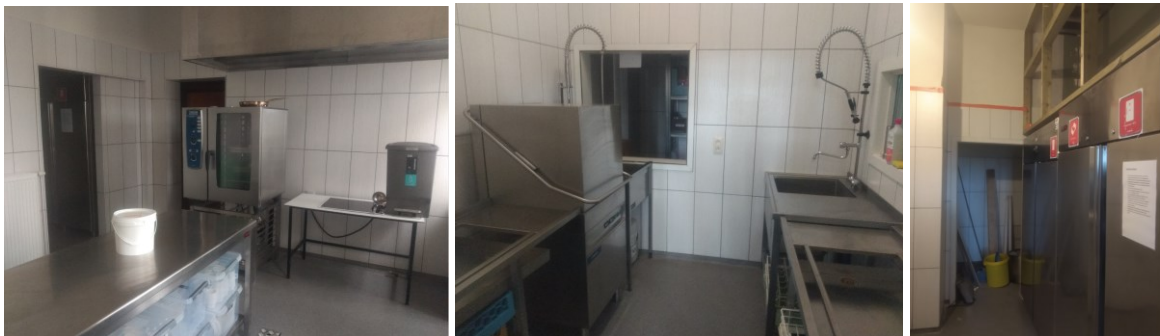
De keuken van den Bayerd in afwerking

Ondertussen is Nautica (onderdeel van het bijzonder secundair onderwijs de Driemaster) uit Merksplas, begonnen met de voorbereidingen voor het ontwikkelen van een eethuisje in Den Bayerd. Van zodra de coronamaatregelen het toelaten willen zij met hun leerlingen Den Bayerd mee openhouden om maandag. Het is zeer fijn deze enthousiaste leerlingen aan het werk te zien in den Bayerd. Hiervoor wordt in het voorjaar de keuken van den Bayerd verder afgewerkt zodat deze keuken zowel kan dienen voor 'brasserie Den Bayerd', als leerwerkplaats voor mensen met een beperking en tegelijkertijd voor huizen Yggdalir en Ekkehart. Op termijn zal den Bayerd ook op meerdere dagen van de week geopend worden door de bewoners van Balder samen met vrijwilligers en mensen die het leuk vinden om als dagbesteding in de horeca te werken. We zijn op zoek naar mensen, vrijwilligers en deelnemers voor de dagbesteding, die graag hun bijdrage willen leveren aan het openhouden van den Bayerd. Op die manier kunnen onze deelnemers bij aan het verzorgen van de zachte recreatie voor wandelaars, fietsers, en ruiters/menners op Wortel Kolonie. Hiervoor wordt met de leadersubsidie ook de toog en de keuken van den Bayerd aangepast om beter te kunnen werken met deelnemers met een beperking.