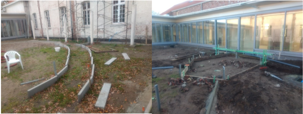
van den Bayerd

Op dit moment werkt de afdeling Groenzorg van vibo de Brem uit Oud Turnhout aan de aanleg van een belevingstuin op het binnenplein van Den Bayerd en huis Yggdalir. Deze tuin wordt een aangename en rustgevende, veilige omgeving voor mensen met een zwaardere beperking maar is ook te gebruiken voor activiteiten die in den Bayerd georganiseerd worden. Zo is 'den Bayerd' een mooie leerwerk- en stageplaats voor deze leerlingen uit het bijzonder onderwijs en helpen ze mee aan de verfraaiing en inrichting van de omgeving