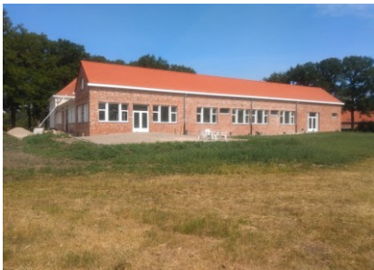
Yggdalir vanuit zuidoosten