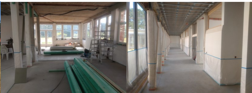
gang naar bewonerskamers

Met het leaderproject 'Den Bayerd' investeert Widar in nauwe samenwerking met de stad Hoogstraten en de provincie Antwerpen via Vlaamse en Europese subsidies in de ontwikkeling van het mooie domein Wortel Kolonie. Op deze manier wordt het voormalige Casino/Den Bayerd opgewaardeerd en helpt Widar mee aan de instandhouding van het historisch erfgoed.